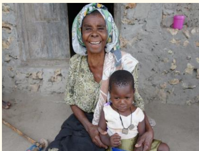
Oma met wees